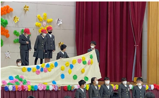
3年生クイズ劇「登り切れ！6年とうげ」