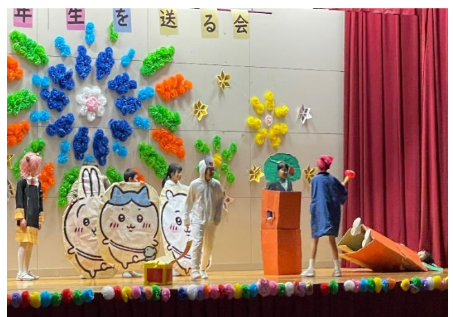
6年生劇「劇団KAWA Iミュージカル 花咲かじいさん2023」