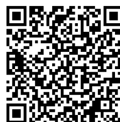
欠席連絡フォーム