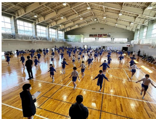
「スタート」の掛け声で一斉にとび出します