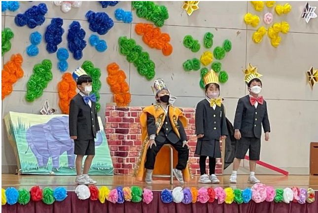
1年生劇「ぞうのたまごとたまごやき」

2月17日（金）の午後から6年生を送る会が行われました。今年度はインフルエンザ感染症の影響で多くの欠席がいたり、臨時休業になったりして、出し物の練習をしていくのも困難な日々が続きました。しかし、本番ではどの学年もすばらしいパフォーマンスを見せてくれたように思います。6年生に対して、それぞれお世話になったことに対する感謝の気持ちをこめて、一生懸命がんばっていました。6年生を送る会の出し物は、後日、ホームページの動画のページにアップロードする予定です。