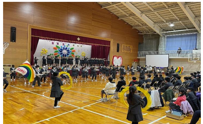
4・5年生金管鼓隊演奏「校歌」