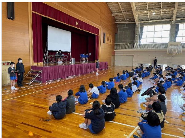
まず、なわとび集会についての説明をききます

27日(月)の午後に、なわとび集会が行われました。会場では低学年、中学年、高学年ごとにフロアいっぱいになわとび、規定の時間を達成できるようにがんばってとびました。前まわしとびのほかにもあやとびや二重とび、後まわしとびなどの技を披露しました。会場内に「がんばれー」という応援や残り時間をカウントダウンする声が響きわたるなど、和気あいあいとした温かみのある集会になったと思います。なわとびは心肺機能や調整力がきたえられるすばらしい運動です。来年度も今回以上の記録が出せるように力を入れていきます。