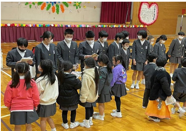
1年生から6年生へプレゼント渡し