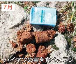
ハイマツの実を食べたフン