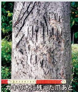
カキの木に残った爪あと