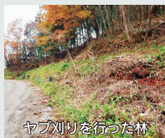
ヤブ刈りを行った林

集落や通学路近くの林は暗くありませんか？クマは身を隠すヤブがあると平気で人家近くまで出没します。地域内を点検し、ヤブ刈りし明るくしましょう。また、カキなどの実は放置せず早めにとりましょう。