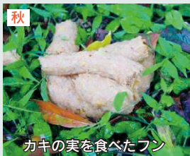
カキの実を食べたフン