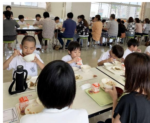
お家の人と食べるのは楽しいね