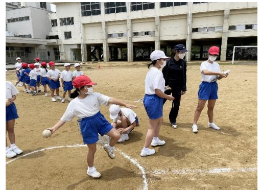
うまくボールを投げられるかな

9日(金)に河井小スポーツフェスタを実施しました。児童は自分の記録をさらに伸ばすことを目標に一生懸命取り組んでいました。今年度は最初に高学年児童が測定を済ませた後、縦割り班の下学年を率いて測定のお世話をする形式にしました。高学年の児童は、計測の補助や下学年児童を整列させるなど校内のリーダーとしてよく働いてくれました。今後も縦割り活動を取り入れながら、学校全体が一つになって活動できる機会を増やしていきます。