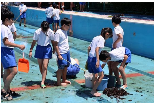
プールの中にも外にも落ち葉がいっぱい

19日(月)に、5・6年生がプール掃除を行いました。天候が少し心配されましたが、当日は掃除日和のいい天気になりました。5年生はプール周辺の溝や更衣室などの掃除を、6年生はプールの中の汚れを落としました。プールの中も外も、落ち葉などがたくさん落ちていてとても汚れていましたが、子どもたちは一生懸命に掃除をしてとてもきれいにしてくれました。これから8月上旬までプールを使っていくこととなりますが、高学年のみなさんに感謝しながら使っていきたいと思えます。