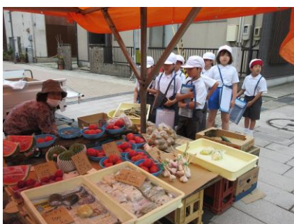
勇気を出して声をかけます

22日(木)に2年海組空組の児童が生活科の学習で町たんけんに出かけました。行先は朝市。いろいろな店の様子を見学したり、お店の人に話しかけたりして、朝市について学びました。天候が少し心配されましたが、無事にたんけんを終えることができました。この後は、学んだことをワークシートにまとめていきます。