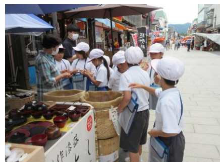
いい香りのする木片をもらいました