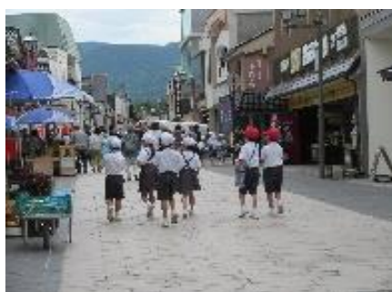
つぎはどこに行こうかな