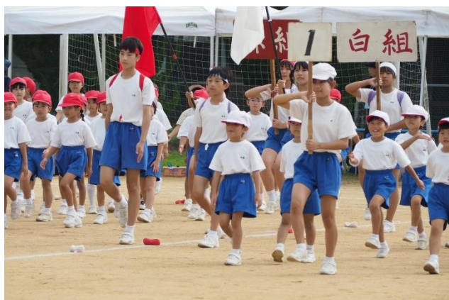
開会式 かつこよく整列しています

9月16日（土）に運動会が行われました。今年度はたいへんな猛暑で9月に入っても暑い日が続きましたが、本番では練習の成果を十分に発揮することができました。スローガンどおり、最後まで全力を尽くす姿が見られ、たいへんうれしく思います。保護者や地域の皆様にはあたたかい応援はもちろん、予行練習前日のテント設営や運動会後の後片づけなどで多大なご協力をいただきました。誠にありがとうございます。今後ともご支援のほどよろしく願いいたします。