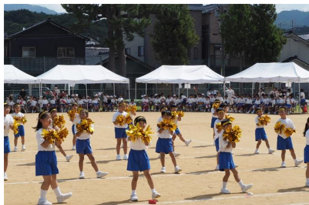
1～2年ダンス「アイドルK小町」