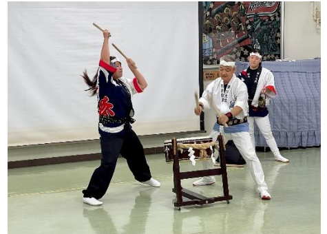
ダイナミックな「キリコ太鼓」