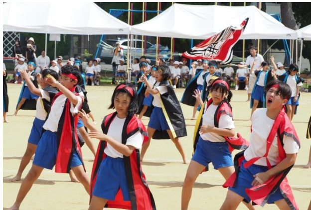
3～6年「よさこい河井ソーラン2023」