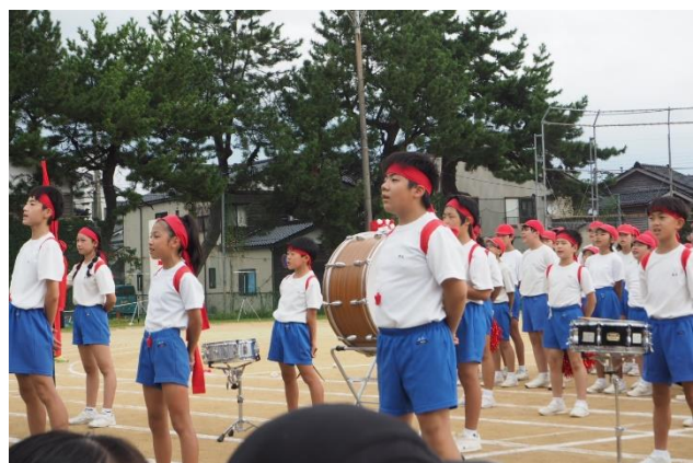
応援合戦 紅組の迫力ある応援