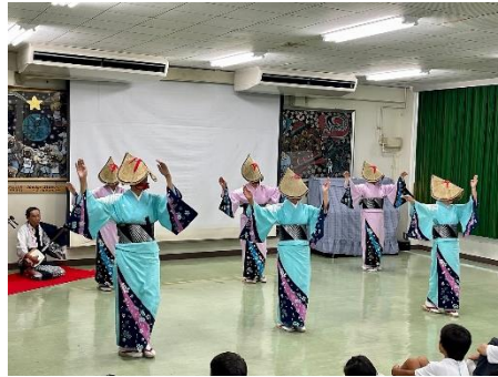
お盆には欠かせない「三夜おどり」