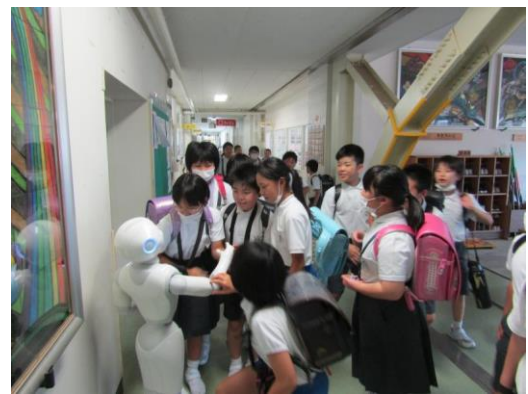
ペッパーくんの周りに人だかりが