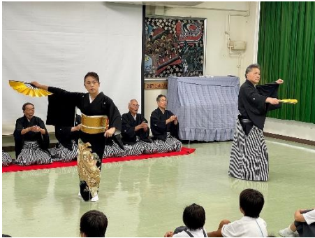
祝い唄である「輪島まだら」