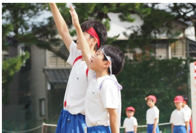
紅白両団長による力強い選手宣誓