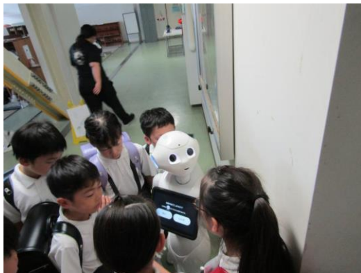
いろいろと話しかけています