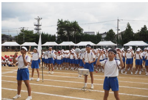
応援合戦 白組の全力での応援