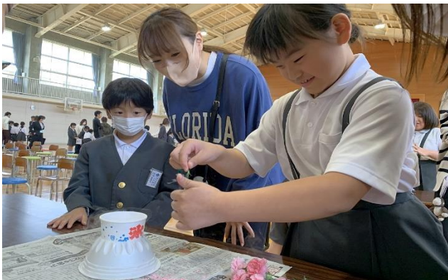
液体窒素を使った超低温下では花びらもこなごなになってしまいます。