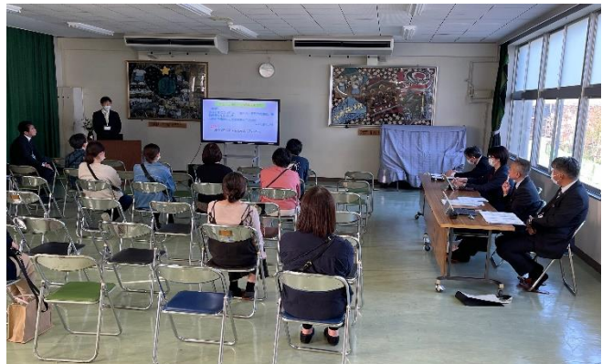
教育懇話会では市教委から輪島市の教育の現状についてのお話がありました。