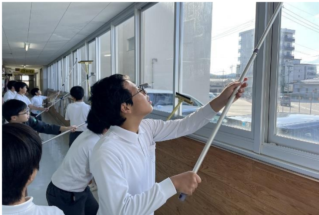
がんばってガラス拭きをしてくれたおかげで、校舎内が明るくなりました。

前述の通り、11月1日（水）～11月2日（木）に学校公開を実施しました。この週は、いしかわ教育の日に指定されており、本校でも様々な取組を企画し、親子ガラス拭き、授業参観、全校集会、市教育委員会主催の教育懇話会などを行いました。お越しいただいた保護者の皆様、教育委員会の皆様には、本校の取組にご理解とご協力をいただき感謝申し上げます。また、ガラス拭き等の準備をしてくださった学級委員会のみなさま、本当にありがとうございました。