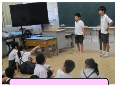
まちがい探しゲーム♪