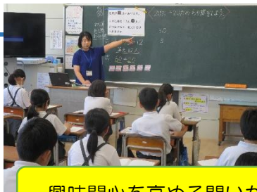
興味関心を高める問いかけや、映像・動画の活用

※実施予定時間は、あくまで目安の時間です。参観される際には十分ご注意ください。 また、児童の健康状態等を考慮し、プログラムを変更・中止する場合があります。