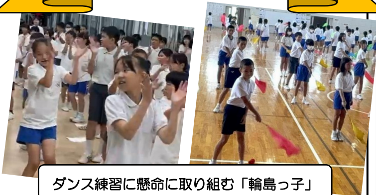
ダンス練習に懸命に取り組む「輪島っ子」

どの学年も運動会に向けて、意欲を高めながら練習に取り組んでいます。昼休みには、声を掛け合って、ダンスの練習に何回も取り組む姿も見られます。