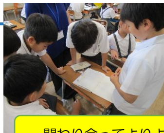
関わり合ってよりよい解決方法を知る