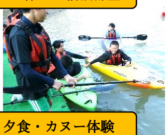
6年生宿泊体験学習：夕食・カヌー体験

前々回の学校だより(7号)においても紹介しましたが、輪島っ子の知的好奇心がはたらく「学ぶ楽しさ」が味わえる授業づくり、学び続けることの大切さを感じる授業づくりを輪島っ子とともに目指しています。