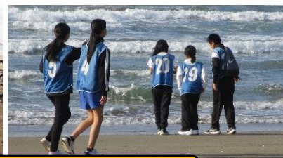
6年生宿泊体験学習：サイクリング