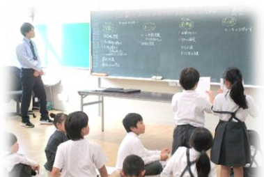
第2回リーダー会の様子