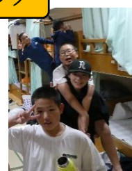
6年生宿泊体験学習：ピザ作り・宿泊部屋