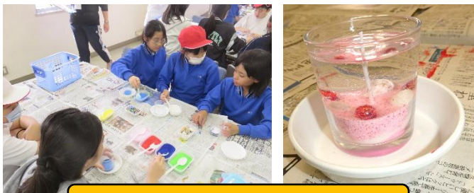
5年生バス遠足：キャンドル作成