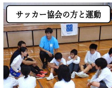
サッカー協会の方と運動