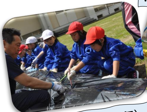
JAあぐりスクール！（1年）