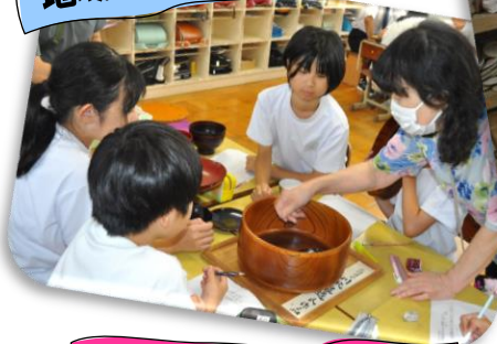
地域の方に学ぶ(5年)