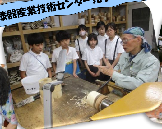
山中漆器産業技術センター見学(5年)