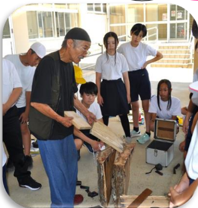
我谷盆について学ぶ(6年)