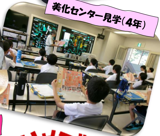
美化センター見学(4年)