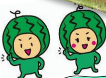
地域の先生に学ぶ！（2年）