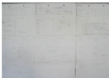
①大まかなレイアウトを紙に書く