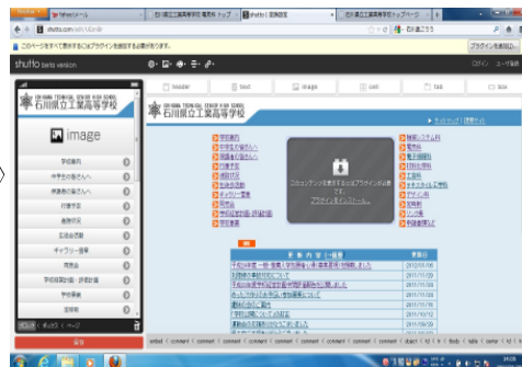
③編集画面が表示される 欲しい要素をドラッグ& ドロップ