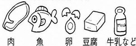
肉 魚 卵 豆腐 牛乳など