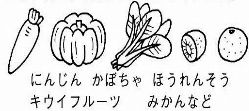
にんじん かぼちゃ ほうれんそう キウイフルーツ みかんなど

かぜをひいてしまったらエネルギー源となる「炭水化物」、基礎体力をつけて、抵抗力を高める「たんぱく質」や、のどや鼻などの粘膜を保護する「ビタミンA・C」などを積極的にとりましょう。