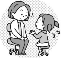
相談や悩みがあるとき