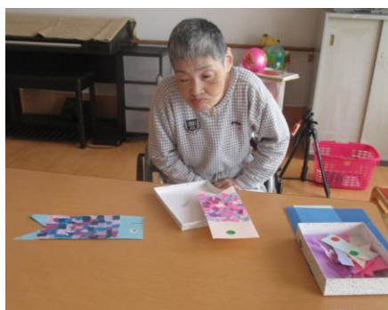
榊：「こんなんになるんやね」