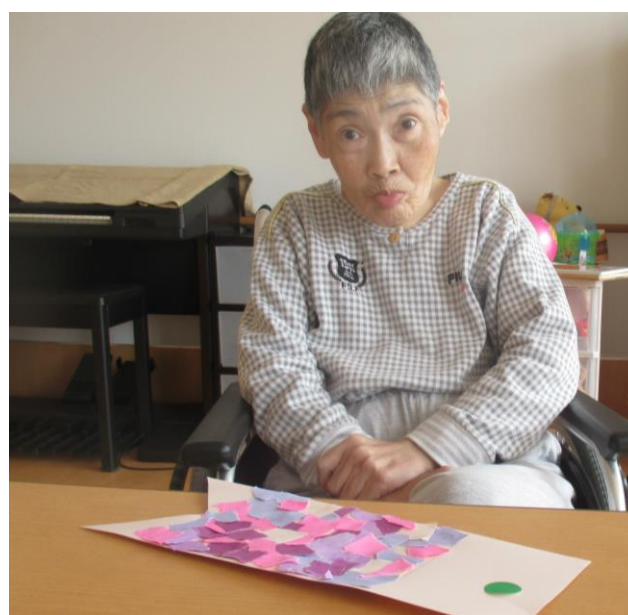
榊：「真ん丸目になったよ！」