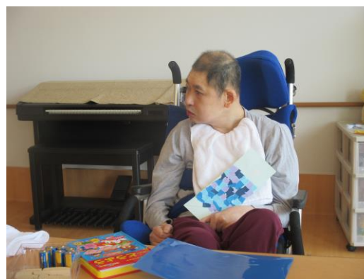
こんな真鯉ができました