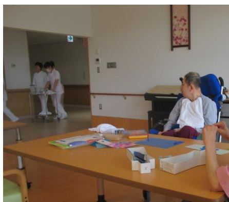
利用者さんも手伝ってくれました