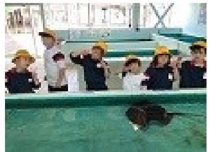
↑ ↓ < 春の校外学習 >

今年もたくさんの巣がありました。教えてくださった皆さん、ありがとうございました。