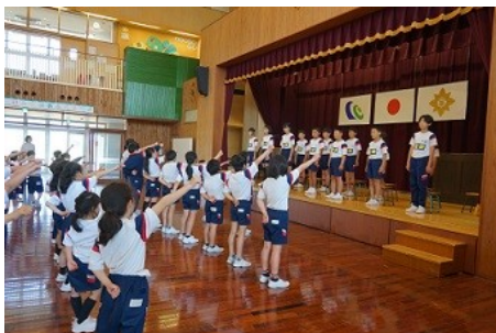
↑ < 連合運送会壮行式 > ↓ < 連合運動会 >