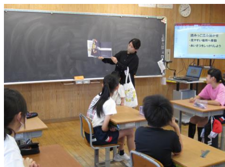
読みっ子クラブの方の読み聞かせ

読みっ子クラブの方に読み聞かせをしていただきました。楽しいお話や怖いお話、初めて聞くお話から発見したこともありました。児童が興味をもてるように、本の種類や内容、そして読み方なども工夫していただきました。