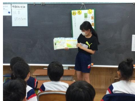
図書委員会の読み聞かせ