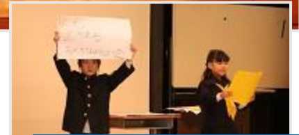
1年生 「ぼくのわたしの No.1 いきものクイズ」