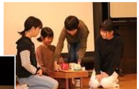
5年生 劇&プレゼン 「超おかわり大作戦」