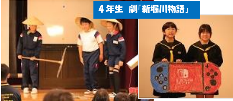
4年生 劇「新堀川物語」

11月10日(日)に「金明っ子学習発表会」が行われました。今まで学習してきたことをまとめ、クイズや劇、プレゼンテーションなどで児童が発表しました。どの学級も工夫した内容で、わかりやすく楽しく伝えてくれました。モニターを使ったり、スクリーンで写真やプレゼンを出したり、小道具で場面を表したりと、たくさんの工夫が見られました。