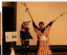
3年生 劇&クイズ 「金明じまん！」