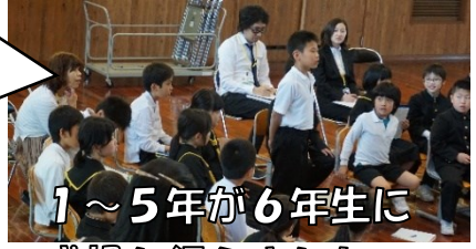
1～5年生が6年生に感想を伝えました

・「〇〇さんの話が良かったので聞いてください。」とステキなパスを出していたのがいいなと思った。 ・グループで活発に相談をしていた。わからないことを質問があって、すてきな学び合いだと思った。 ・全員で反応しているし、全員が発表していた。6年生全員で授業をつくっていたのがすごいと思った。