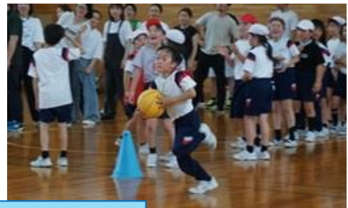
3 年「ボール送り」「ピンポン玉運び」「王様ドッチボール」