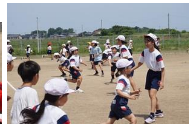
最後の振り返りでは、たくさんの方が発表しました。