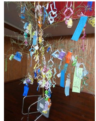
金明竹に七夕飾り