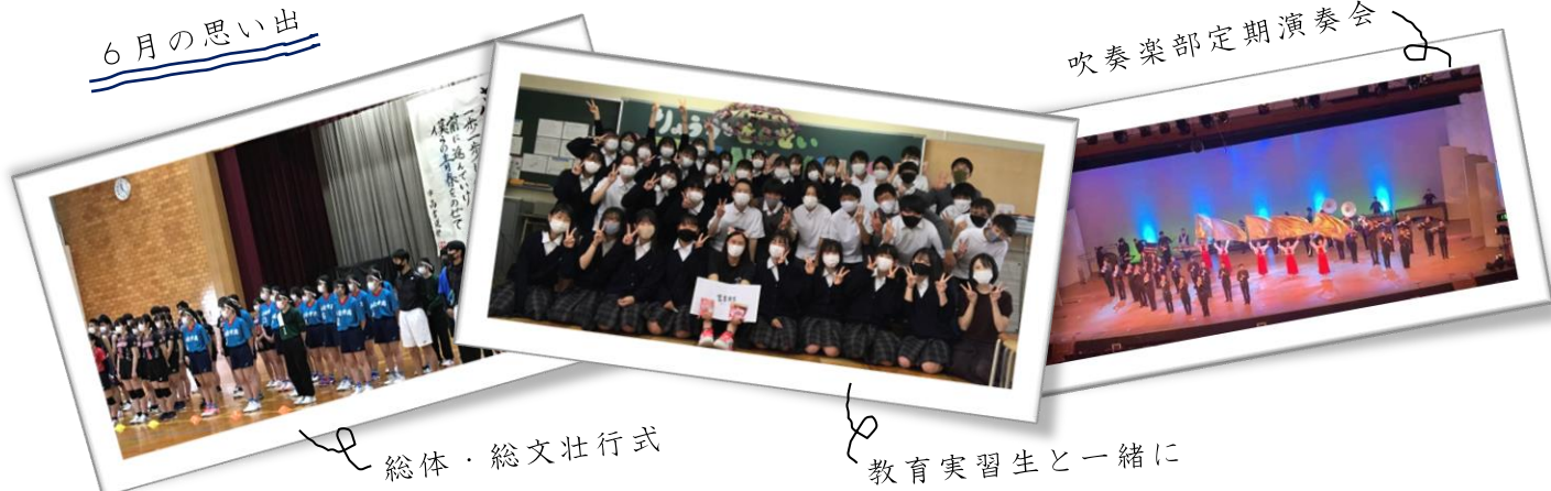
総体・総文壮行式