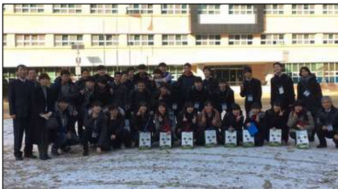
大田科学高校の前で記念撮影