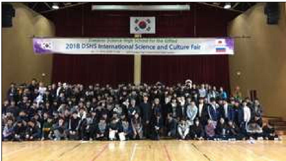
参加者全員で記念撮影 with Daejeon Science High School(韓国) and Aero-Space Lyceum(ロシア)