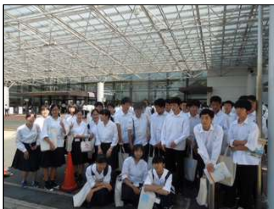
神戸国際展示場の入口で