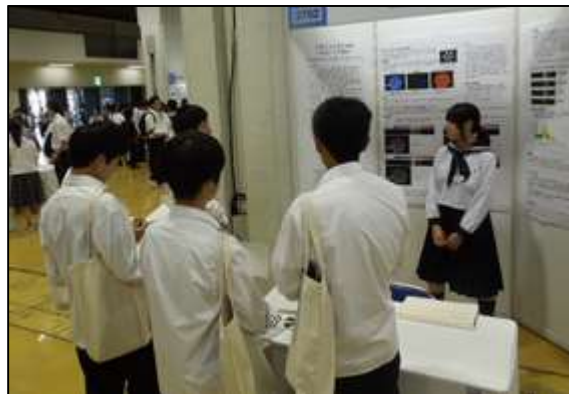
1年生も積極的にポスターを見て、質問していました。