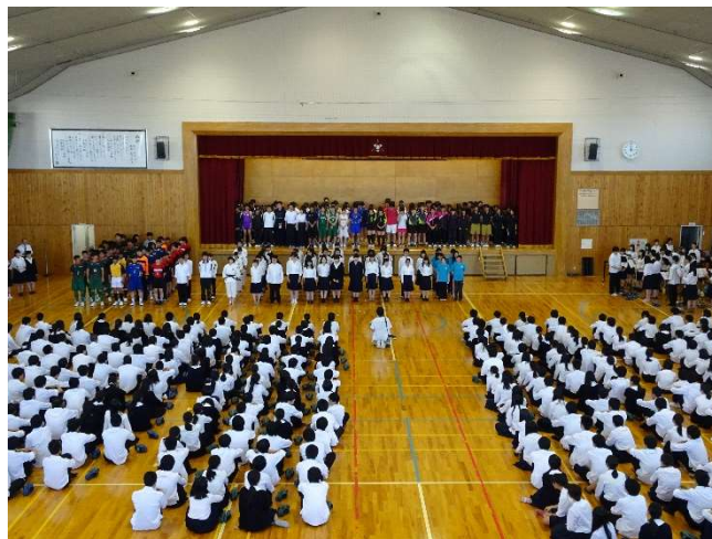
高校総体・総文壮行式の様子

PTA総会に引き続いて開かれた学年別懇談会では、正副担任の紹介の後、学年の状況、修学旅行についての説明が行われました。お忙しい中ご出席いただいた保護者の皆さま、ありがとうございました。