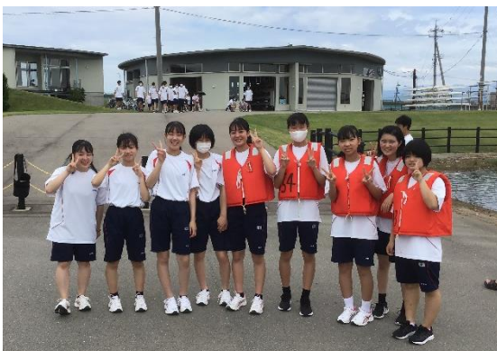
ボート大会に向けて練習！