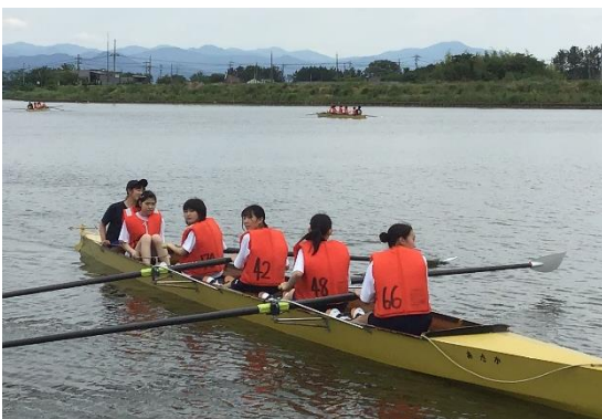
ボート大会に向けて練習！