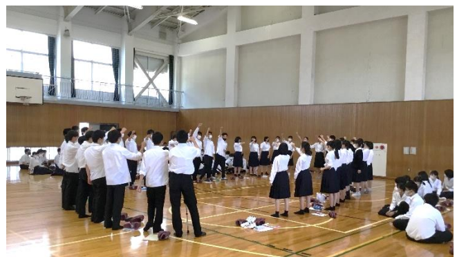
期末考査に向けてファイト！