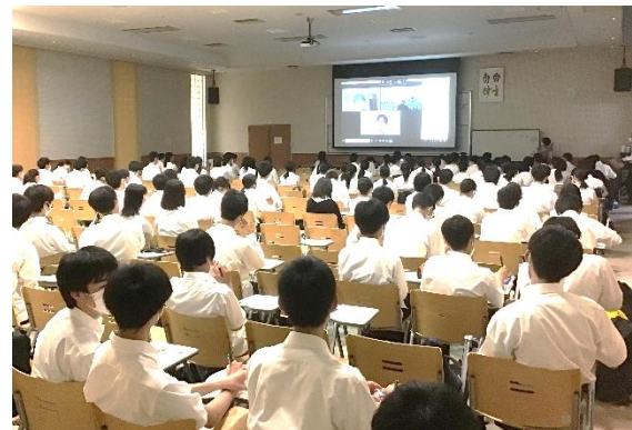
学問・大学探究 大阪大学の先輩とリモートで！