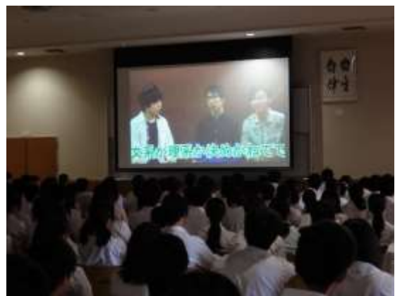
学年集会「東大生に聞く」

本校を卒業し東大に合格した先輩たちが、高い進路を目指してもらおうと、一年生への特別メッセージを届けてくれました。インタビュー構成で語られた東大生からは、「なぜ高い志望を目指したか」「一年生の時はどれぐらい勉強していたか」など、気になる内容についてそれぞれが本音で語りながら、日々の努力の積み重ねの大切さや、勉強だけでなく部活動や学校行事全体を通して人間力を鍛えることの意義などを伝えてくれました。一見かけ離れたように見える東大生も同じ出発点から高校生活を送ってきたことがわかり、東大でなくとも、今後進路を考えるうえで大いに刺激になったことと思います。