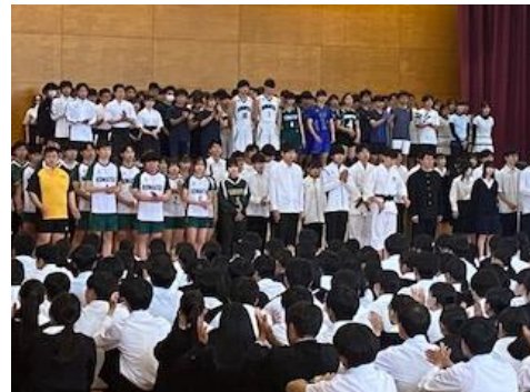
高校総体・総文 壮行会

様々な進路学習を通して、将来どのようになりたいか、大学で何を学びたいかを主体的にじっくりと考えてほしいと思います。