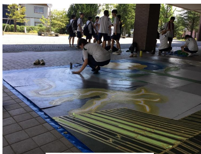
黄団 マスコット準備中