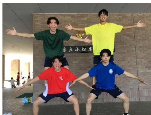
団長 4人 頑張りました！