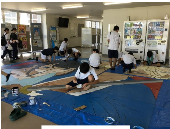
青団 マスコット準備中