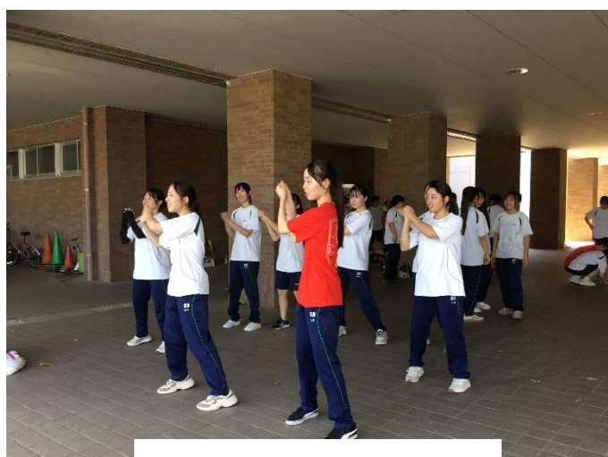
赤団 団パフォーマンス準備