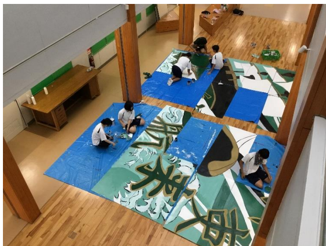
緑団 マスコット準備中