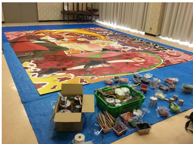
赤団 マスコット準備中