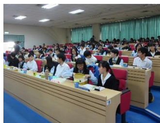
人文(国立新營高級中学)

人文科学コース35名の生徒が台湾で、理数科は24名の生徒が韓国で、それぞれ海外交流をしてきました。交流校では、日本・石川・小松の紹介や課題研究の成果の発表を英語で行い、活発なやりとりが見られ、実のある交流の機会となりました。