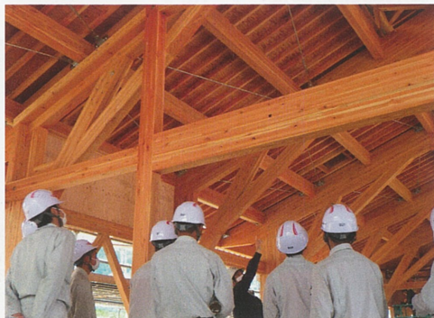
■ 建設現場見学 3年

建設科は、工事だけでなくこれらの仕事に関わる幅広い分野へ対応した人材の育成を目指しています。