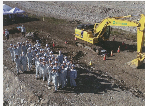
■ 現場見学 1年