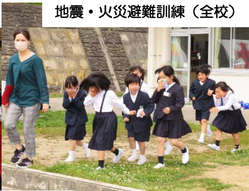
地震・火災避難訓練 (全校)