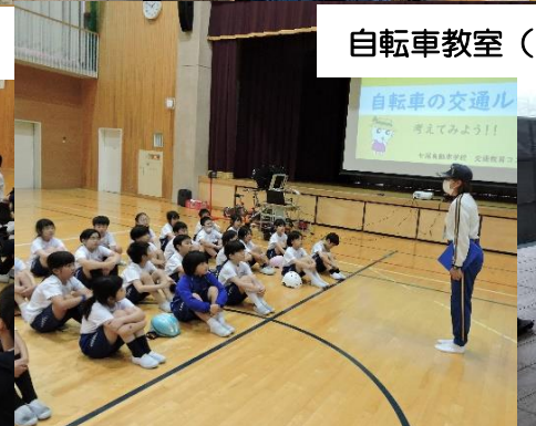
自転車教室 (3年) 七尾自動車学校