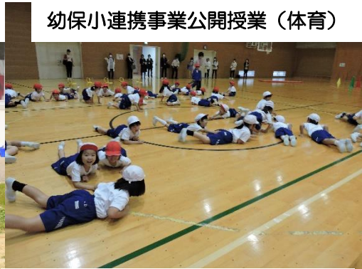
幼保小連携事業公開授業 (体育)