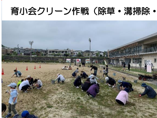
育小会クリーン作戦 (除草・溝掃除・花植え)