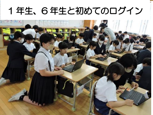
1年生、6年生と初めてのログイン