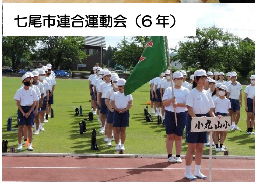
七尾市連合運動会 (6年)