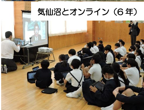
気仙沼とオンライン (6年)