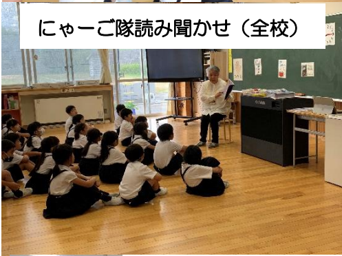
にゃーご隊読み聞かせ (全校)