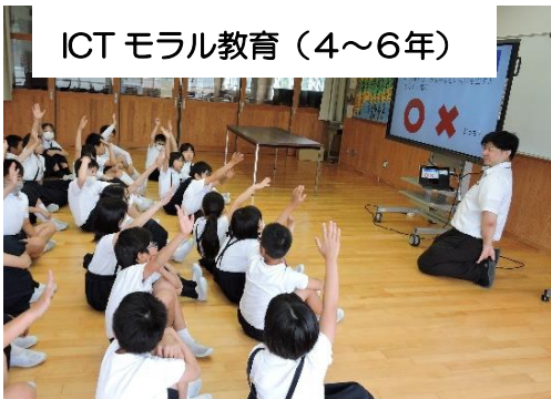
ICT モラル教育 (4～6年)