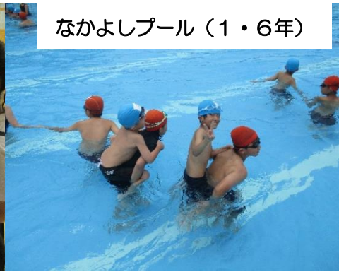
なかよしプール（1・6年）