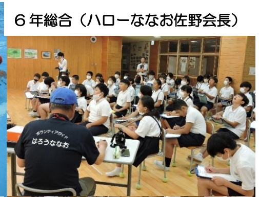
6年総合（ハローななお佐野会長）