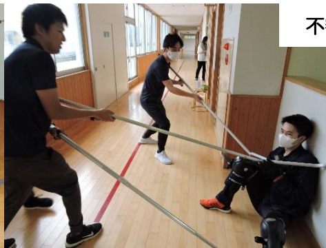
不審者訓練・防犯教室)