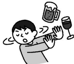
タバコ、お酒、薬物、 誘われても断る