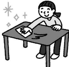
だらだら、ごろごろ せず、体を動かそう