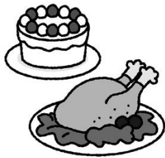
クリスマス、お正月、 食べすぎに注意