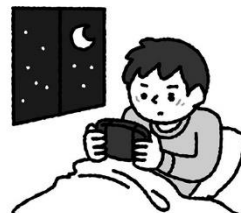
夜更かししないで 規則正しい生活を