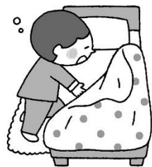
とにかく休む (あたたかくして早寝しよう)