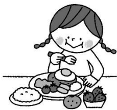
しっかり食べて栄養をとる (ビタミンCがおススメ)