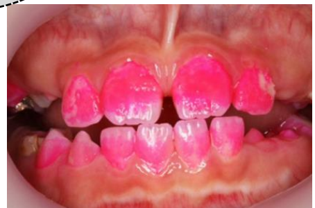
↑こんな感じに写真を撮ります

⑥ 歯みがきをする。赤く染まった部分は歯垢（プラーク）です。鏡を見ながら赤い部分がなくなるまで工夫してみがきましょう。