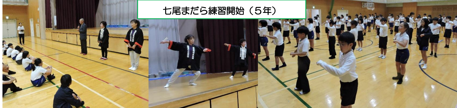
七尾まだら練習開始 (5年)