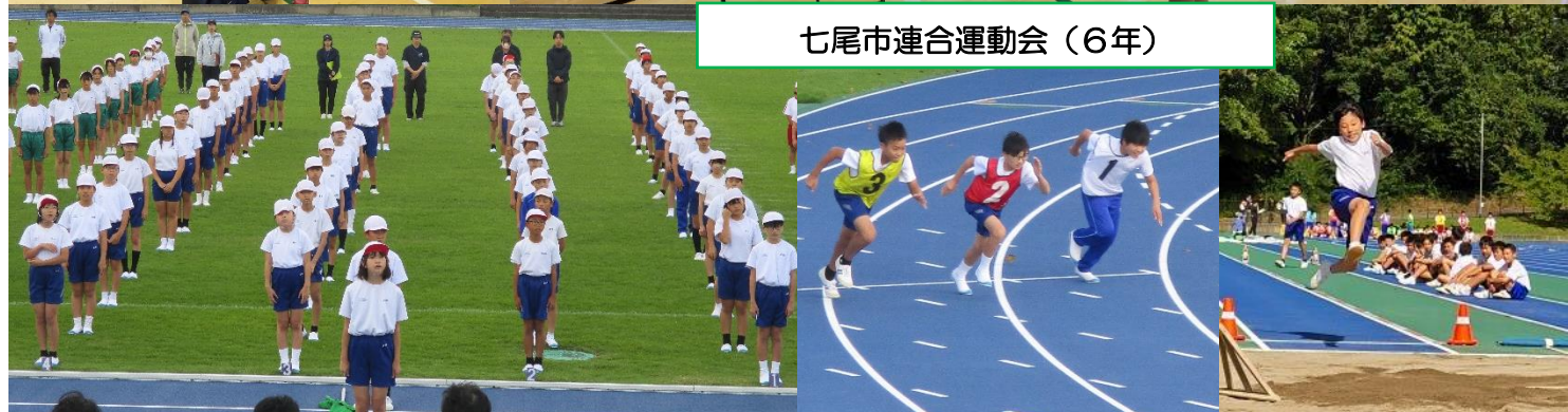
七尾市連合運動会 (6年)