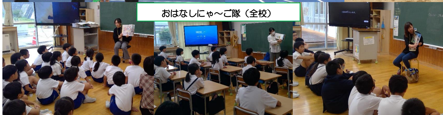
おはなしにゃ〜ご隊 (全校)