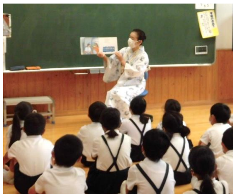
お話にゃ〜ご隊読み聞かせ