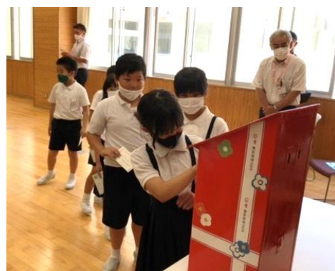
はがきの投函(3年生)

月末の保護者面談では、学校と家庭が協力して子どもを育てていくことができるようお話できればと思ひます。よろしくお願ひいたします。