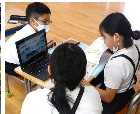
パソコンを使った授業(4年生・6年生)