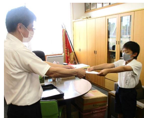
児童会役員任命式(校長室)