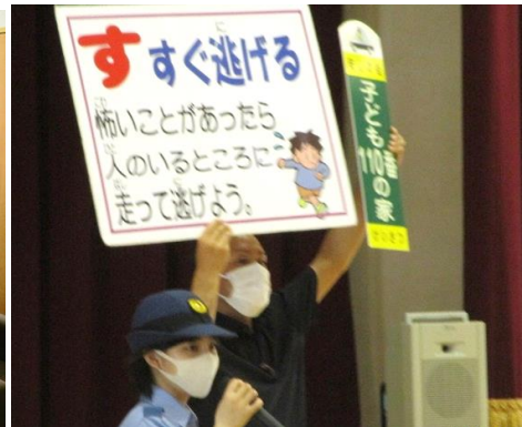
防犯教室(いかのおすし)