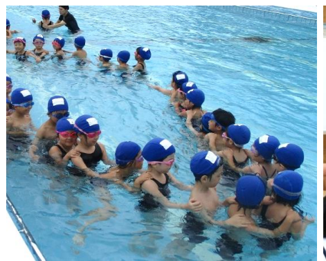
初めてのプール(1年生)