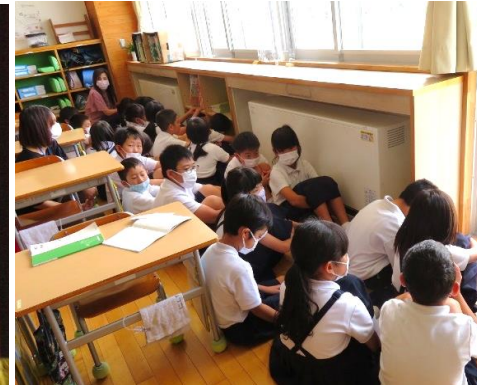
不審者対応の避難訓練(2年生)