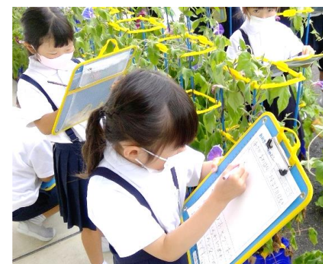
あさがおの観察(1年生)