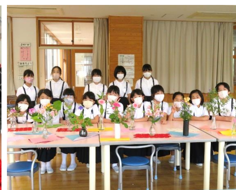
フラワーアレンジメントクラブ