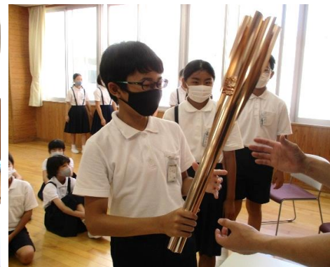
オリンピック聖火トーチ