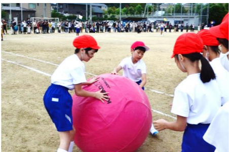
3・4年 大玉ころがし