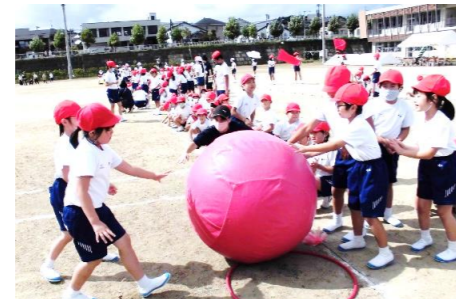
1・2年 大玉ころがし