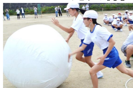
5・6年 大玉ころがし