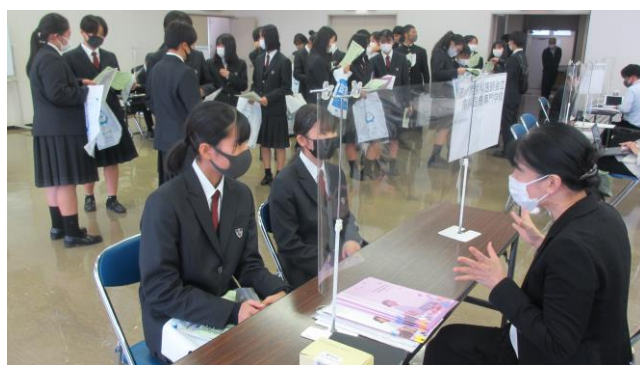
[上級大学見学会のようす]