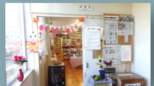
季節に応じて飾り付けを工夫している図書室

いつもにぎやかで図書館司書は、いつも本を借りて読んでくれる仕掛けを考えています！ほんの一部ですが、図書館の活動を紹介します。