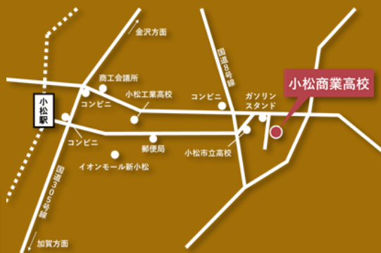
学校へのアクセス JR小松駅より小松バス 希望ヶ丘下車徒歩0分