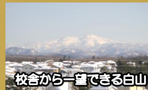
校舎から一望できる白山