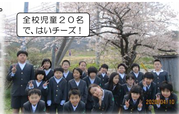
全校児童20名 で、はいチーズ！