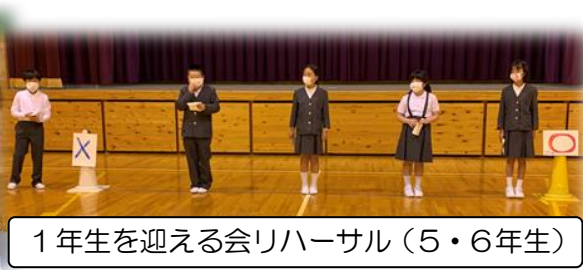
1年生を迎える会リハーサル（5・6年生）