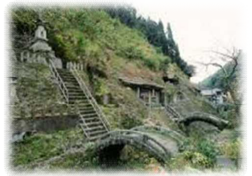
こうざん ぎん ばしよ 鉱山(銀がとれる場所) ら かん じ ごひやくら かん 【羅漢寺五百羅漢】

せかいじゅう ひと たからもの 世界中の人たちの宝 物とし まも ひつよう たいせつ て守っていく必要のある大切 ぶんかざい たてもの しぜん な文化財(建物)や自然のこ とをいいます。