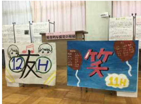
クラス旗と総合的探究の時間 全員展示

2学期は夏休み明けテストと向陽祭で幕を開けました。ほとんどの生徒が順調に学校生活に入っていると思います。