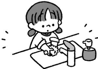
手を洗って花粉を流そう