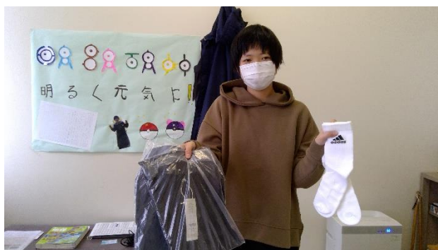
☼ 洋服、くつ下 うれしい