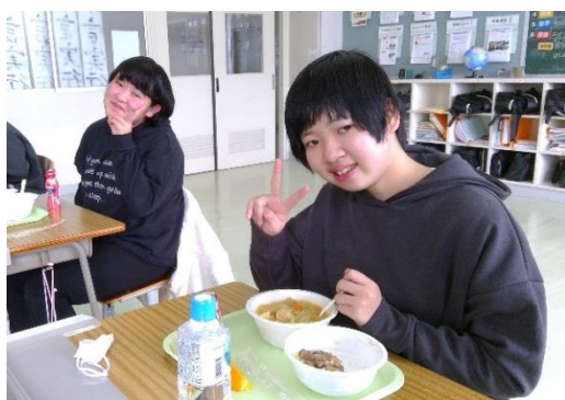
☼ 炊き出しが楽しみ☺

学校には、昼食の炊き出しをはじめ衛生用品や衣類などの支援物資が毎日のように届きます。支援の輪がどんどん広がり、物資や義援金などがたくさん能登半島に集まっているのですね。このような支援のおかげで、今の私たちの生活が支えられていることに感謝の気持ちを忘れずにいましょう。そしていつか恩返しができるとうれしいですね！