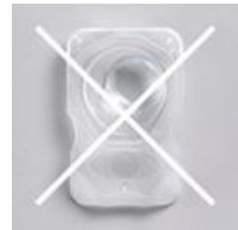
コンタクトは残さない