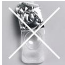
アルミを完全にとること