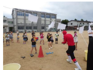
【白熱！水鉄砲バトル】

9月13～14日、おやじの会主催「松小校庭キャンプ」が約180名の参加で盛大に開催されました。コロナで中止になっていた時期はありますが、歴史ある松任小の恒例行事です。今年も「シャボン玉パフォーマンス」「水鉄砲バトル」「校内肝試し」等、盛りだくさんのイベントで、子どもたちは家族や友達と大変楽しいひと時を過ごしました。おやじの会の皆様にはお忙しい中、計画・準備、そして、当日のお世話、本当にありがとうございました。参加した子どもたちには、ずっと心に残る思い出になることと思います。