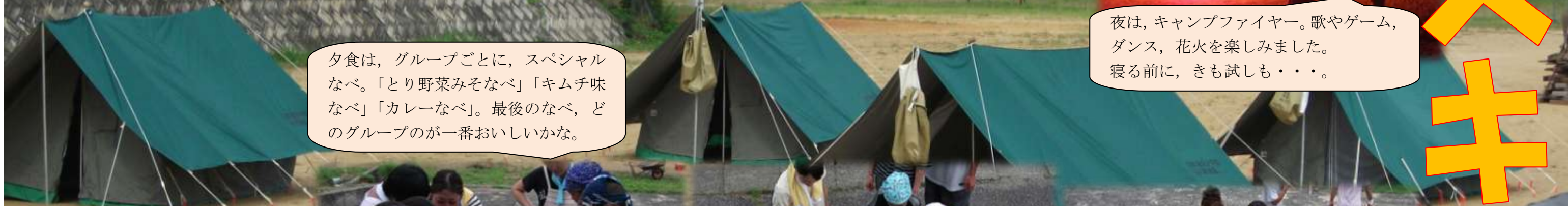
夕食は、グループごとに、スペシャルなべ。「とり野菜みそなべ」「キムチ味なべ」「カレーなべ」。最後のなべ、どのグループのが一番おいしいかな。