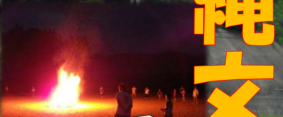
夜は、キャンプファイヤー。歌やゲーム、ダンス、花火を楽しみました。寝る前に、きも試しも・・・。