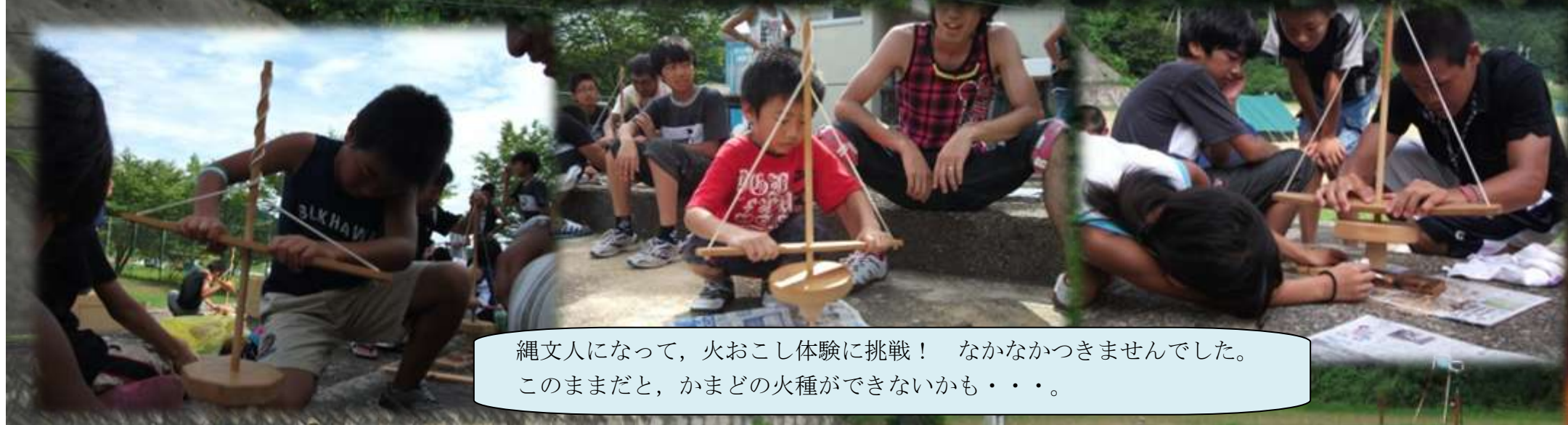
縄文人になって、火おこし体験に挑戦！ なかなかつきませんでした。このままだと、かまどの火種ができないかも・・・。