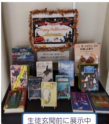
生徒玄関前に展示中