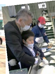
食品トレーの選別体験