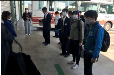
仕事内容の説明を聞きました

例年は、3日間行われていた「わく・ワーク体験」ですが、今年度は半日の職場見学&体験という形で3月11日(木)と15日(月)に行われました。訪問したワークショップひなげし・リサイクル工場は、リサイクルできるように食品トレーを分別している事業所です。説明を真剣に聞き、事前学習で学んだとおり、実際に、ベルトコンベアー上での選別作業や投入、運搬等の体験をしました。