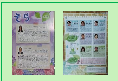
令和3年5月31日(月)に広報誌「そら」22号を発刊しました。