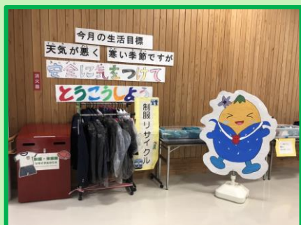
令和3年度の文化祭は、学校と協力し、感染対策を徹底し工夫した形で実施しました。PTAでは、催し物と制服リサイクルを行うことができました。