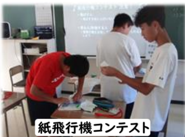
紙飛行機コンテスト

8月中旬ごろからさまざまな大学生による学習支援活動をしていただきました。例えば、金沢工業大学の学生による紙飛行機コンテストや金沢大学の学生による自画像教室、科学実験教室なども行われました。部活動単位での参加となりましたが、3年生の数学の補講などにも入っていただき、学習の支援をしていただきました。学生の皆様、本当にお世話になりました。